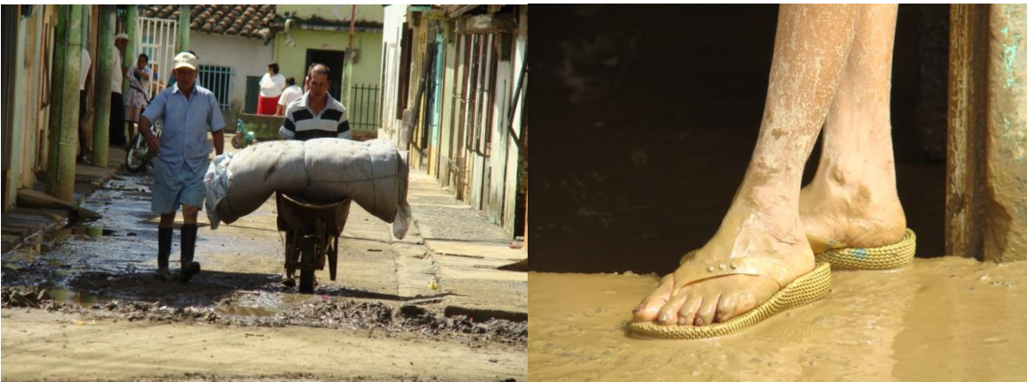
La realidad vale más que mil palabras