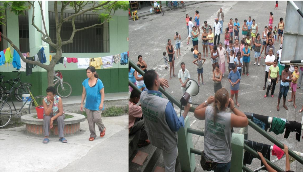
Incertidumbre y promesas