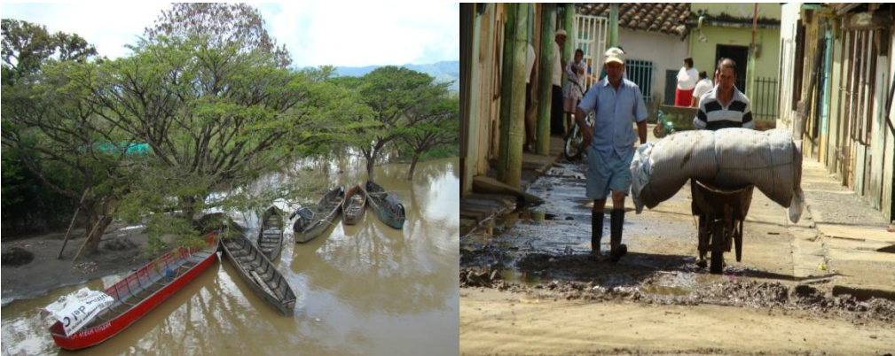
Puerto dulce de Colombia lleno de inundación, pobreza y olvido