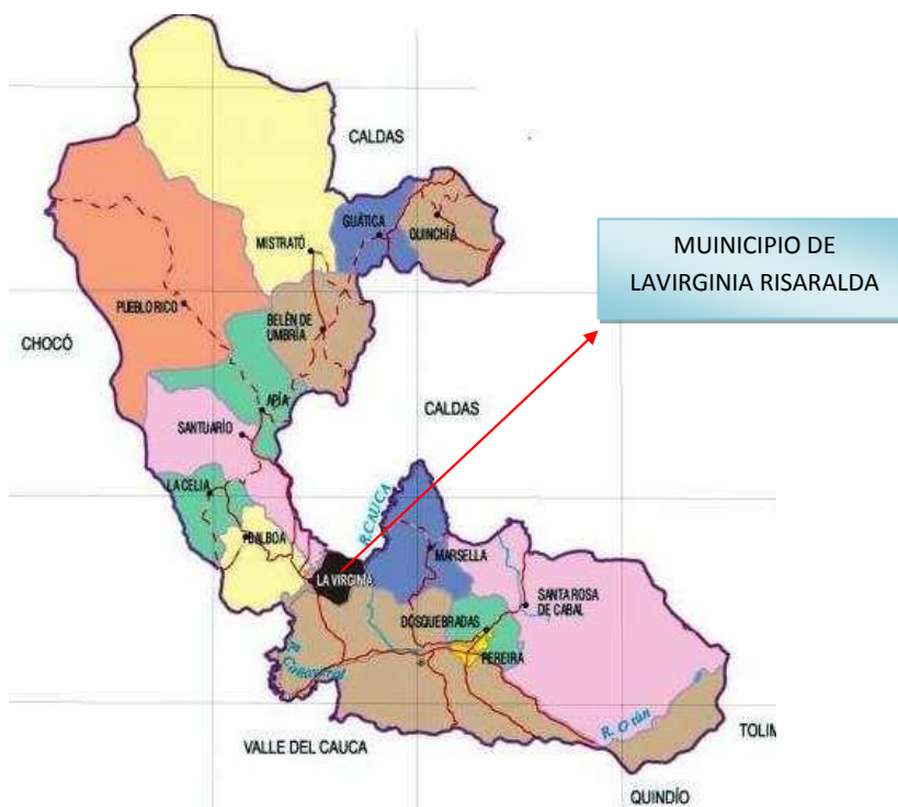
Figura 1. Localización del Municipio de la Virginia en el Departamento de Risaralda y en la Subregión III.

Comentario [U8]: ¿De dónde sacaron esta información???????